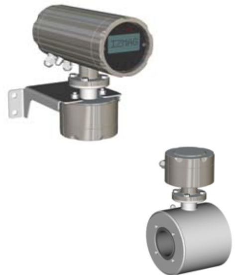
Abb.: der IZMAG™ in getrennter Bauform

Der IZMAG™ wird standardmäßig in kompakter Bauform geliefert. Optional ist eine getrennte Bauform möglich (siehe Bild rechts).