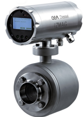
Abb.: mit optionalem Schweißstutzen

Der IZMAG™ wird standardmäßig in kompakter Bauform (siehe Bild rechts) geliefert. Optional ist eine getrennte Bauform möglich.