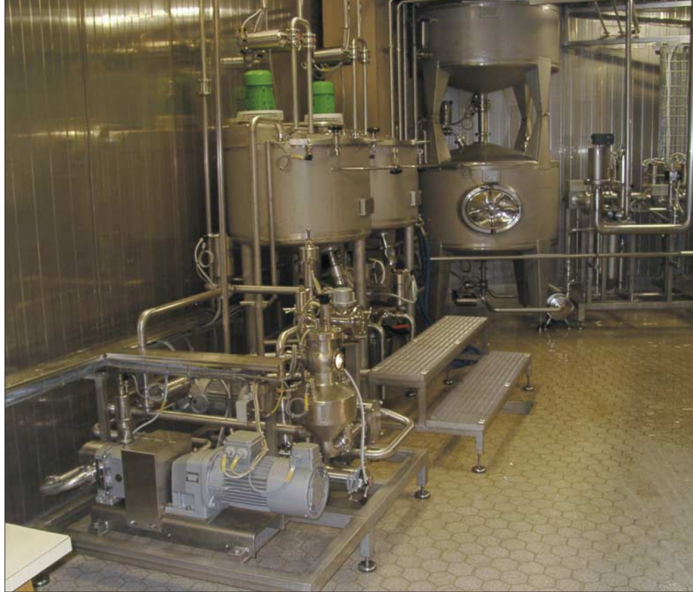
Batchanlage mit Tandembehälter.

Für die homogene Vermischung von Produkten mit sehr unterschiedlichen oder hohen Viskositäten werden Mischer (statisch oder dynamisch) in die Anlage integriert. Auf einen Mischer kann verzichtet werden, wenn z.B. nachgeschaltete Pumpen für eine gute Vermischung sorgen.