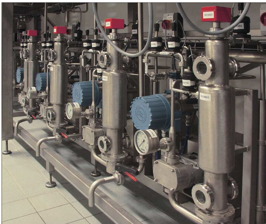
Ansicht einer Dicon, mit Entlüftungsfässern.

Die kontinuierliche Ausmischung kommt in erster Linie beim Ausmischen von Fertiggetränken zum Einsatz. Mit der Dicon werden flüssige Komponenten bereits in der Rohrleitung in einem konstanten Verhältnis miteinander vermischt. Aufgrund der Verwendung von digital arbeitenden Reglern wird das Mischungsverhältnis auch bei schwankendem Gesamtdurchfluß konstant ge-